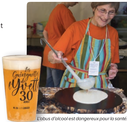
Labus d'alcool est dangereux pour la santé.